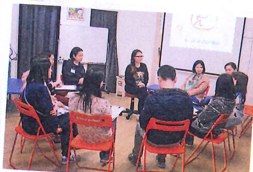
慈慧幼苗中心不時舉辦親子課程，讓家長學習教養之道。