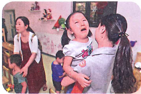
要離開父母步入校園，對孩子而言是一大挑戰。

家長亦應在開學前兩星期起為子女做好開學的心理準備，讓他們對上學有正面印象，包括老師很疼愛學生，會教授很多有趣知識和遊戲，校內亦有很多同學作伴等，「家長切忌以自己或老師來威嚇孩子，例如說若他們不乖老師會責罵，又或不來接他們下課等，這會令孩子更害怕上學。」