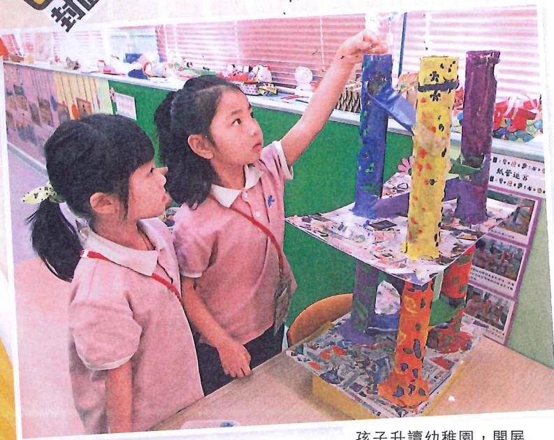
孩子升讀幼稚園，開展有紀律的群體生活。

暑假轉眼快到尾聲，親子是時候收拾心情迎接開學。然而，每年九月都有一群學生須接受新挑戰，他們就是升讀幼稚園和小學的新生，面對新環境、新老師和新同學，需要較長的適應時間，甚至有機會出現情緒問題，其實家長只要細心扶子女一把，把握最後兩周時間，做好預備工夫，就可讓孩子快快樂樂開學去。