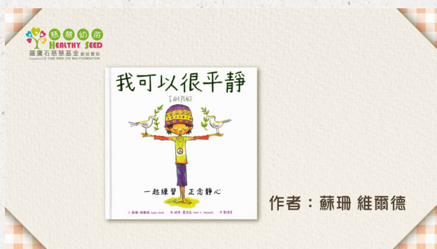
讀繪本學情緒——《我可以很平靜：一起練習正念靜心》