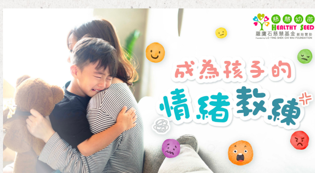
成為孩子的情緒教練