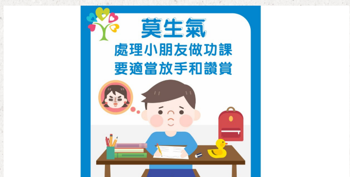
莫生氣 處理小朋友做功課要適當放手和讚賞