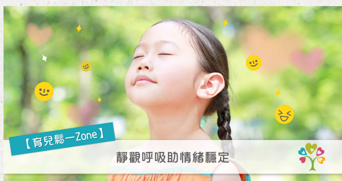
靜觀呼吸助情緒穩定