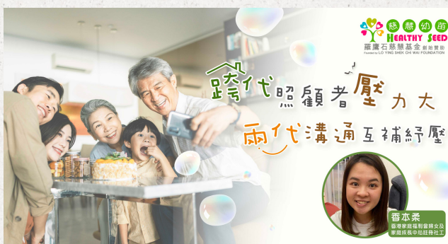
跨代照顧者壓力大 兩代溝通互補紓壓